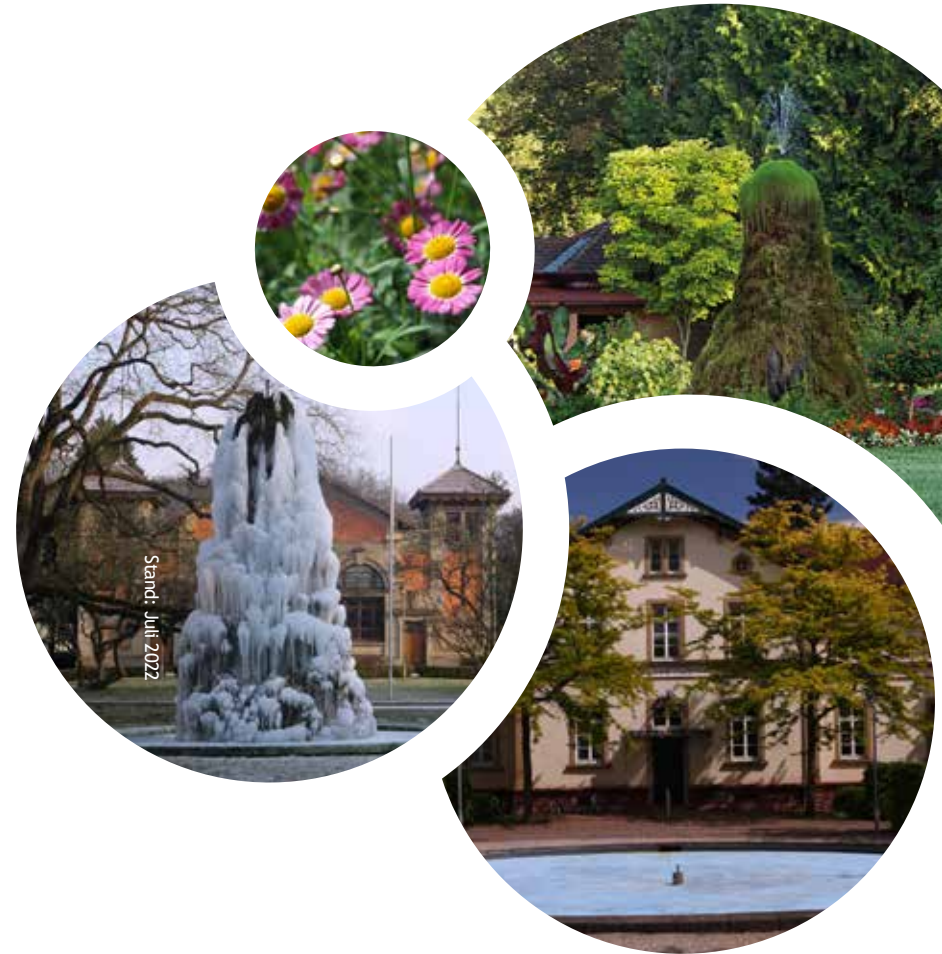
Stand: Juli 2022

Ein Unternehmen der Zfp-Gruppe Baden-Württemberg