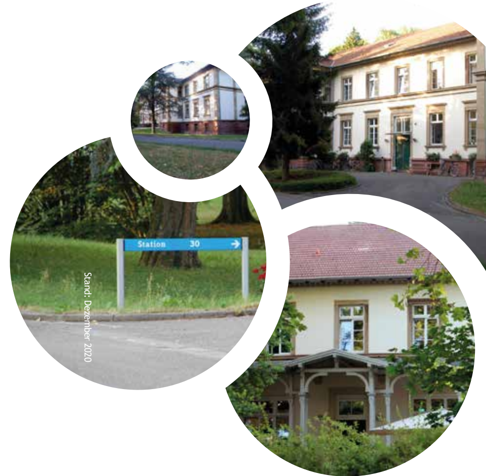
Stand: Dezember 2020

Ein Unternehmen der ZFP-Gruppe Baden-Württemberg