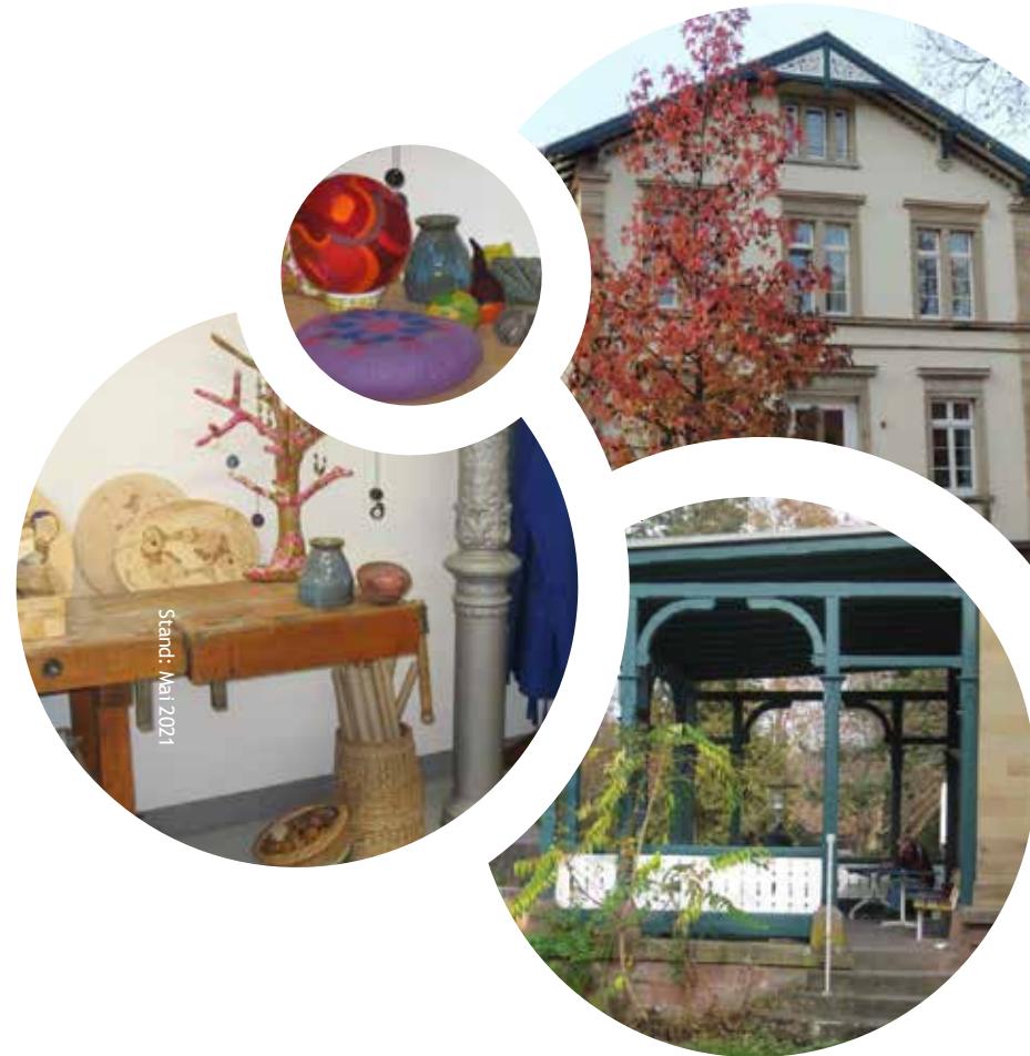
Stand: Mai 2021

Ein Unternehmen der ZfP-Gruppe Baden-Württemberg