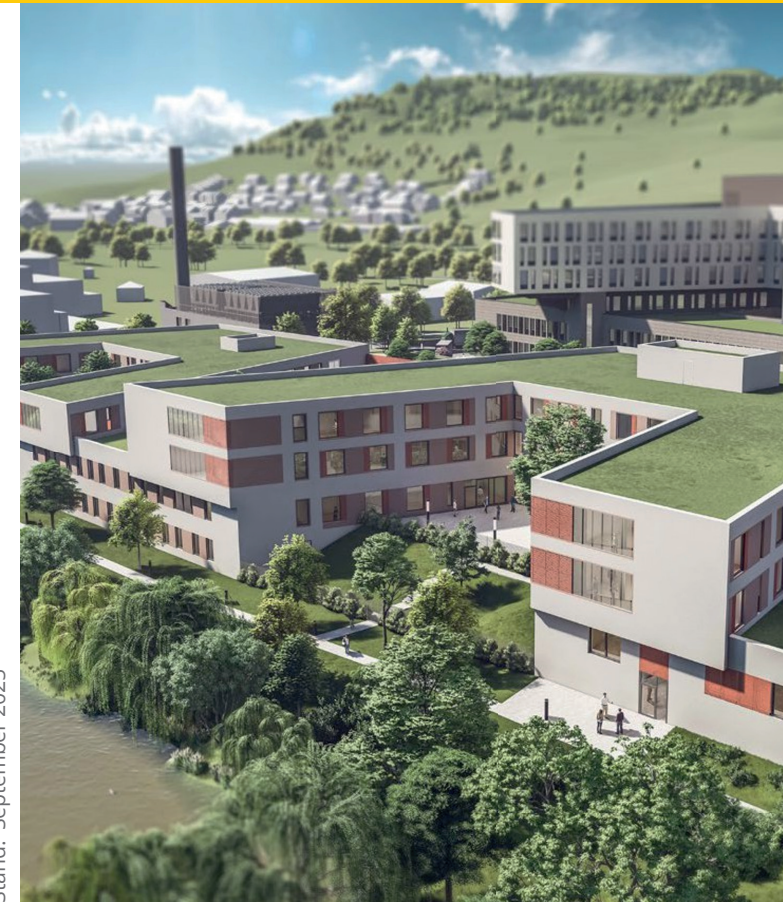
Stand: September 2025