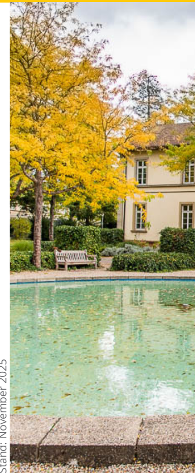
Stand: November 2025